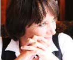
LA VENTANA DE MANENA