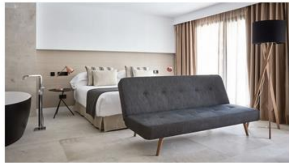
Nakar Hotel / Palma de Mallorca