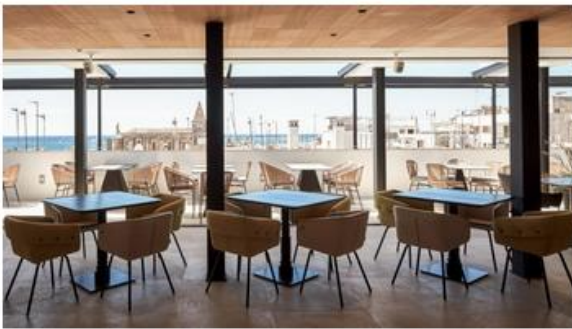
Nakar Hotel / Palma de Mallorca

Wer eine Pause braucht von der permanenten Cocktail-Hour der Balearen, findet im hauseigenen Spa im Untergeschoss seine Ruhe. Ob man sich im einzigen Indoor-Pool der Altstadt treiben lässt oder für die Sauna entscheidet – Entspannung ist garantiert. Die Zimmerpreise beginnen bei 168 Euro pro Nacht. Mehr Informationen zum Hotel sind auf designhotels.com zu finden.