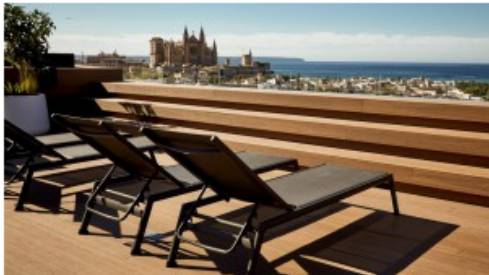
Nakar Hotel / Palma de Mallorca

Das Hotel liegt an einem der Shopping-Boulevard Palmas, der Jaime III Avenue, zwischen Designerläden, Concept Stores und Galerien. Wer dem Klang der Kirchenglocken folgt, gelangt am Ufer zur Kathedrale von Palma, die im 13. Jahrhundert erbaut wurde, und auch die Strände Ciudad Jardin und Can Pastilla sind zu Fuß in nur 15 Minuten erreichbar.