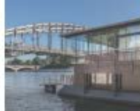
Off Seine, el primer hotel flotante de París.