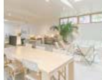
Margot House, lujo discreto en el centro de Barcelona.

Todo un estreno que nos espera en Palma. Desde 203 €/noche.